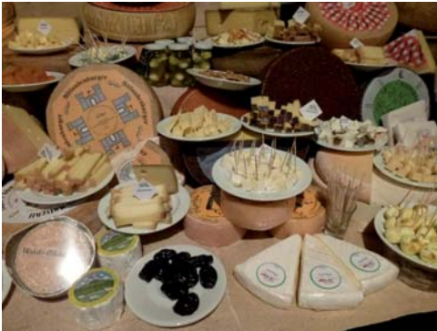
KNW-E, 16. Juni 2014