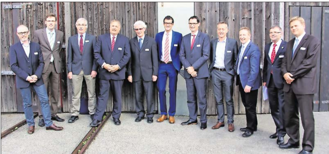
Die Referenten des Informationsanlasses waren Vertreter von Politik, Wissenschaft und Wirtschaft.