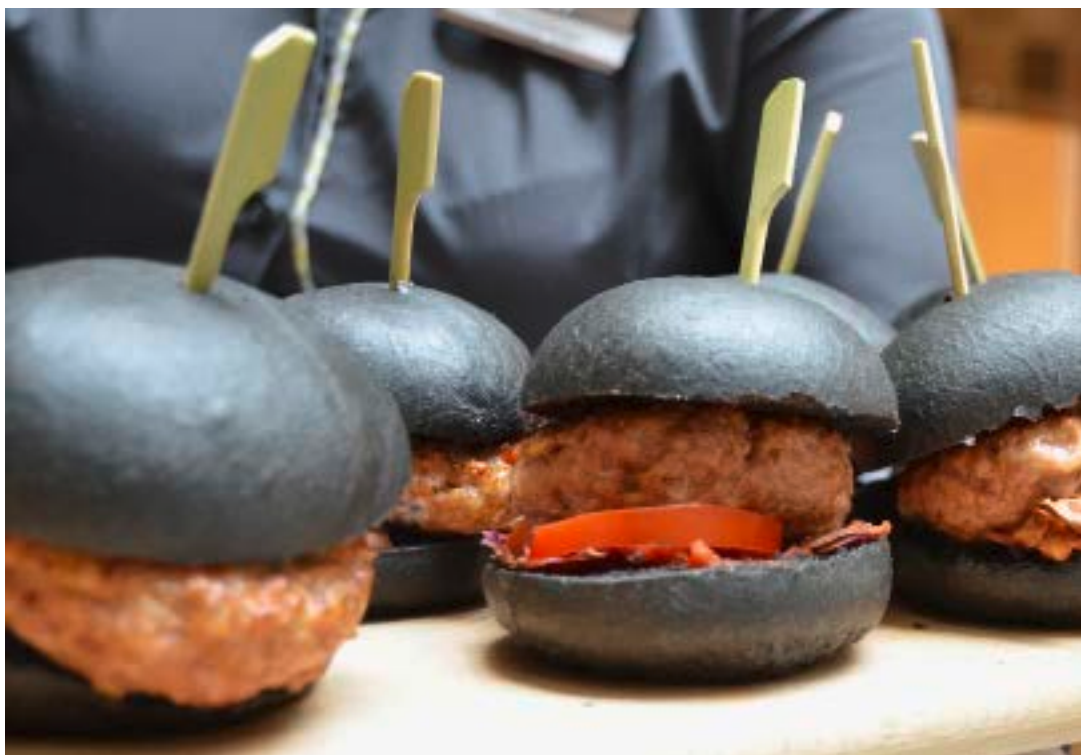
Hamburger einmal anders, mit Brötchen aus schwarzem Mehl. • Le hamburger revisité, avec un bun à la farine noir.

Diese Steigerung komme jedoch nicht der menschlichen Ernährung zugute, sagte ETH-Professor Erich Windhab, sondern das Verteilungsproblem würde zunehmen und der Getreideanteil, der ins Tierfutter und in die «Biotreibstoffproduktion» wandere, steigen. Die Wertschöpfungskette sei gefordert. In der Produktion kann gemäss Windhab mit «Vertical Farming» der Ertrag gegenüber dem konventionellen Feldanbau um das 150-fache gesteigert werden. Im Gewächshaus könne zehn Mal mehr auf der gleichen Fläche geerntet werden. Es gelte aber auch die nutritive und die sensorische Qualität zu steigern, sagte Windhab. Und vor allem die Nachernteverluste zu senken, die durchschnittlich 30 Prozent ausmachen. Die Verarbeitung von Agrarrohstoffen müsse auch effizienter werden, beispielsweise mit neuen Extrusionsverfahren, um Proteine aus Soja zu gewinnen.